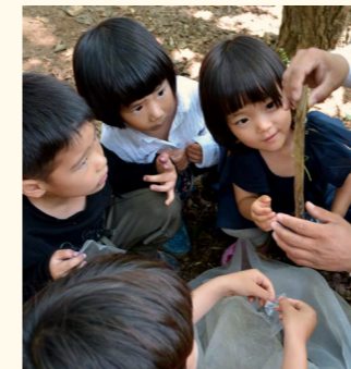
Chunggesan Waldkindergarten in Seoul, Süd-Korea