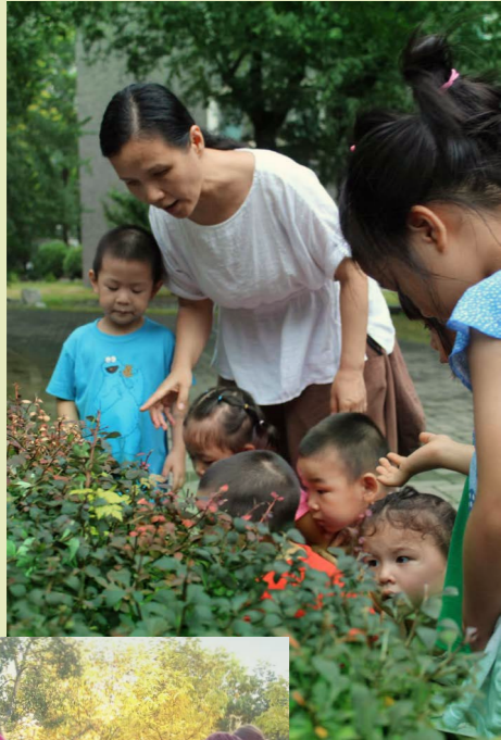
Wawaguan Baby Garden, Peking, China

Am 2. Novemberwochenende 2018 treffen sich in Berlin Experten für Natur- und Waldkindergärten aus Europa, Asien und Amerika.