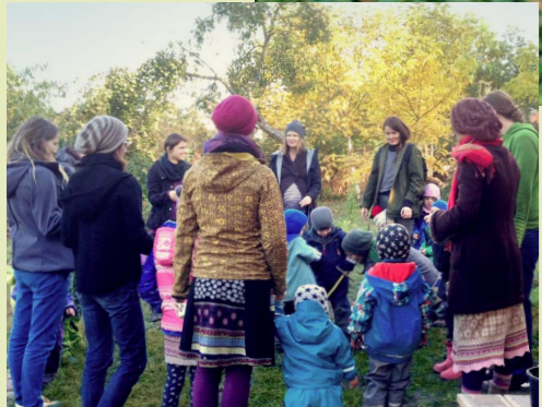
mateřských škol „Hvězdy v lese“ in Prag, Tschechien