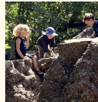
Berkeley Forest School, in Kalifornien, USA