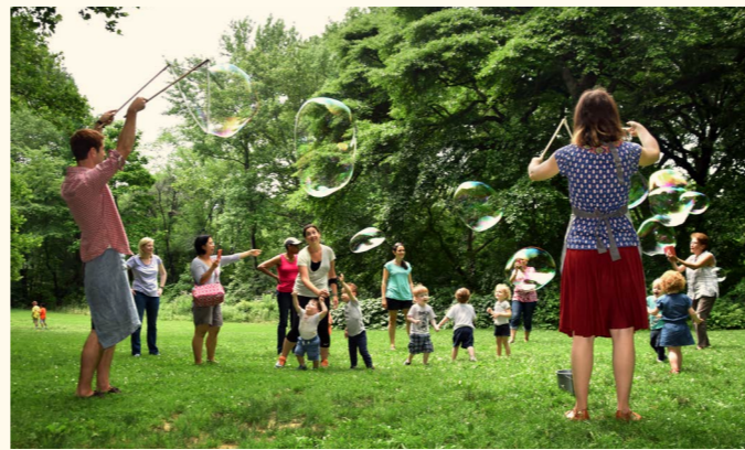
Brooklyn Forest parent-child classes, in Central Park New York, USA