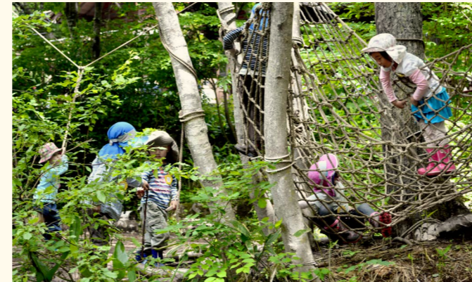
Kodomo no Mori Kindergarten in Nagano, Japan